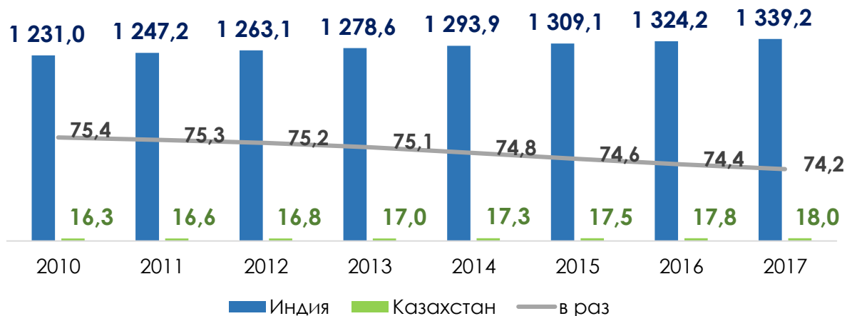
Численность населения, млн человек*

Индия – вторая в мире по численности населения страна в мире. В 2017 году экономически активное население составило 520,2 млн человек, в 2014 году – 495,0 млн человек*. Из них в 2014 году численность занятых в промышленности составила 13,9 млн человек, в обрабатывающей промышленности - 6,4 млн человек**.